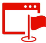
Mehrsprachige Business Website (TYPO3)