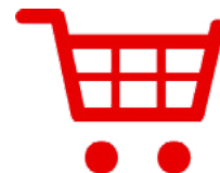
Werbemittelshop für intern und extern