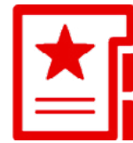
Konzeption und Beratung