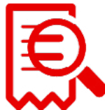
Technische Suchmaschinen Optimierung