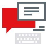
Entwicklung von Kommunikationsmitteln